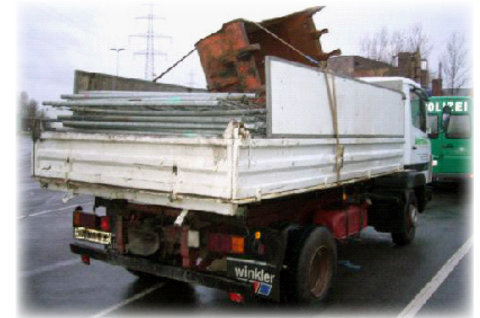
So sollte es nicht aussehen